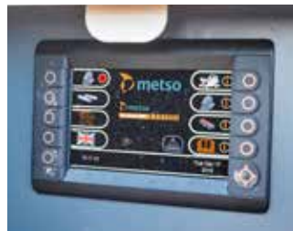
Brecherautomatisierung immer serienmäßig für einfache Bedienung