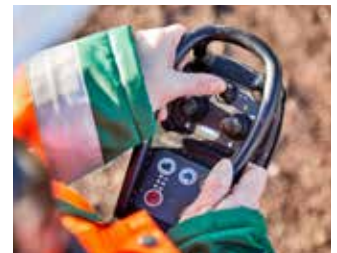
Fernsteuerung für Raupenfahrgewerk serienmäßig