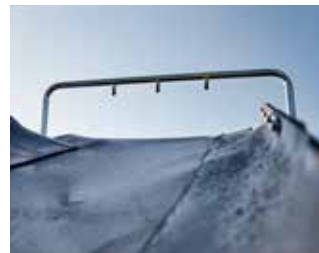
Wassersprühsystem mit Pumpe für effiziente Staubunterdrückung