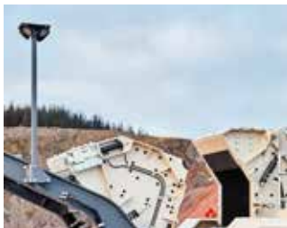
Arbeitsleuchten serienmäßig für bessere Arbeitsergonomie und Sicherheit